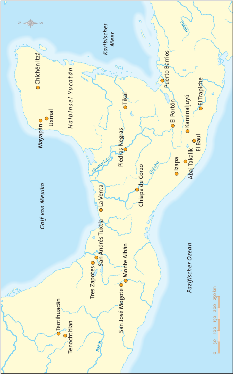
KARTE 1 Mesoamerika