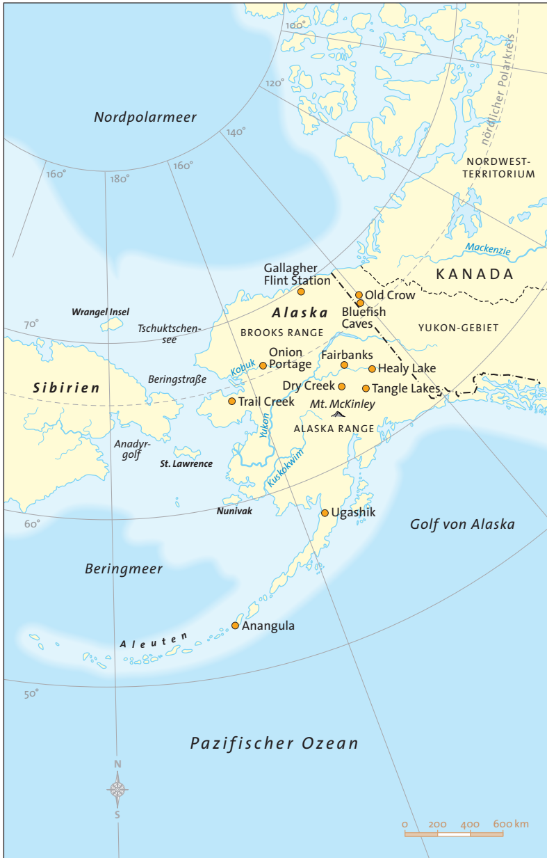
KARTE 2 Die «Beringia» genannte Landbrücke zwischen Asien und Nordamerika, über die frühe Jäger nach Amerika eingewandert sind.