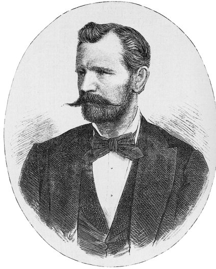
Abb. 1: Carl Humann. Stich in der «Berliner Illustrierten Zeitung» vom 4. November 1882

Carl Humanns stehen sollte – nicht nur die erste, sondern, wie sich rasch zeigte, eine ausgezeichnete Wahl.