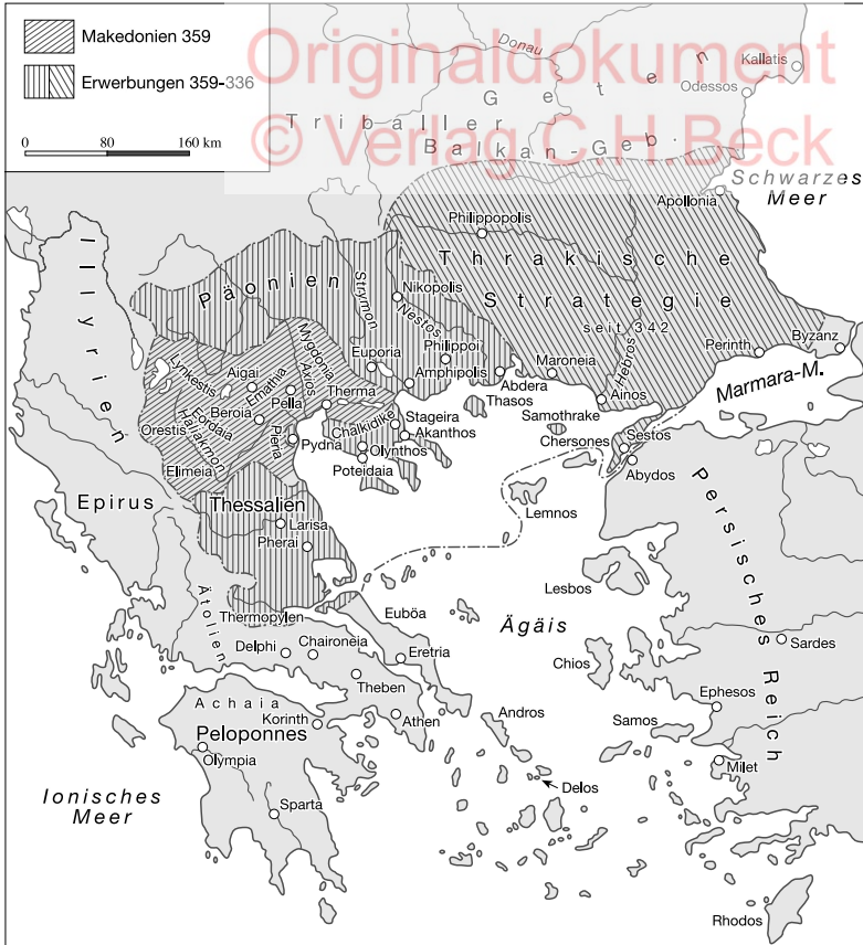
Karte 1: Der Aufstieg Makedoniens unter Philipp II.

die makedonischen Generäle Parmenion und Attalos eröffnet. Hier traten die Makedonen mit dem Anspruch auf, die Griechenstädte an der Westküste Kleinasiens vom «Joch der Perserherrschaft» zu befreien. Die Stoßrichtung des späteren Alexanderzuges war damit bereits vorgegeben. Freilich hatten weder König Philipp noch die ihn unterstützenden Griechen die Absicht, das Perserreich der Achämeniden zu stürzen. Das hät-