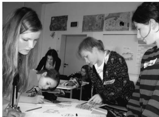
Abb. 5: Achtklässler gestalten gemeinsam ein Plakat für die Präsentation.