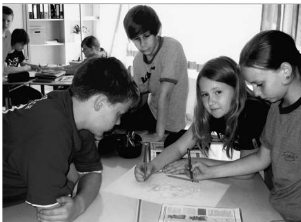
Abb. 4: Schüler/innen arbeiten gemeinsam an einer Wochenplanaufgabe.