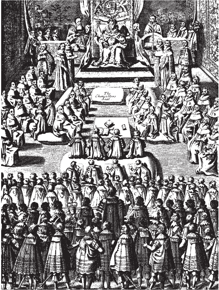
Elisabeth in ihrem Parlament. Zeitgenössischer Stich (Ausschnitt)

William Cecil, Elisabeths engster Berater und vierzig Jahre lang ihr informeller Regierungschef, trotz zeitweiliger Anfeindungen einen gesicherten Stand. Er wurde 1571 als Lord Burghley in den Adelsstand erhoben und blieb bis zu seinem Tod im Amt, das 1598 auf seinen zweiten Sohn Robert überging, den Jakob I. 1605 zum Viscount Salisbury adelte. Auch Elisabeths zweiter Staats-