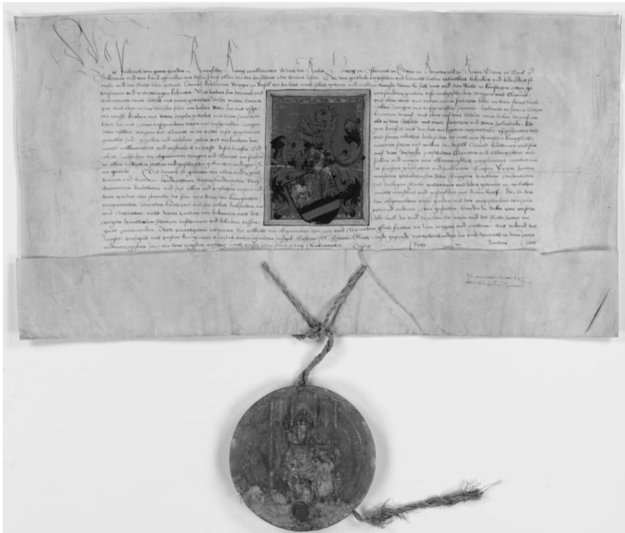
Abb. 1: Wappenbrief, ausgestellt durch Friedrich III. am 10. September 1442, StABS SLL Sammlungen Urkundenregesten, Klosterurkunden: Kartaus Nr. 154.