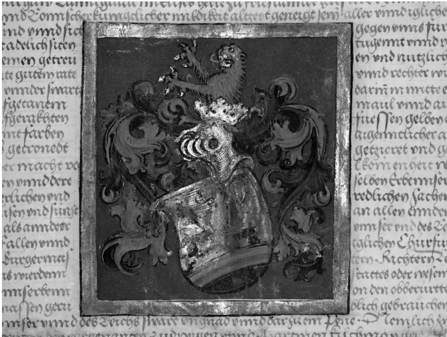
Abb. 2: Wappenbesserungsbrief, ausgestellt durch Maximilian I. am 31. August 1498, StABS PA 302.1.