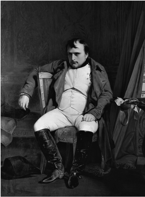
Napoleon 1814 in Fontainebleau

verweigerte seine Unterschrift mit der Begründung, dass der Vertrag für seine Regierung nicht von Belang sei, stellte aber einen «act of accession», also eine Protokollnotiz, in Aussicht, d. h. man werde den Vertrag zur Kenntnis nehmen, verweigere aber jegliche Mitverantwortung für seinen Inhalt. 55