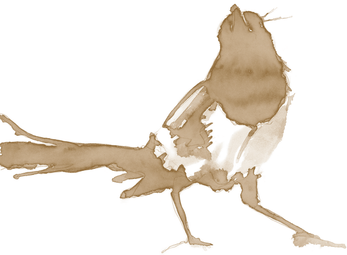
Elster (Pica pica bactriana)