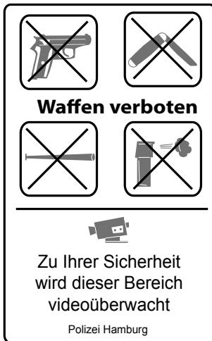
Abb. 2: Kennzeichnung von Waffenverbotsgeländen 1

Räume können zum Synonym für Unsicherheit oder Kriminalität werden: Man denke beispielsweise an das Hamburger Vergnügungsviertel St. Pauli (vgl. Abb. 2), die französischen Banlieues, die Aufmarschräume rechtsextremer Aktivisten, die südafrikanischen Townships oder die brasilianischen Favelas. Unsicherheiten und Risiken werden oft als sogenannte Angsträume verortet: z.B. der am Abend gefährliche Stadtpark, unbelebte U-Bahn-Stationen oder Bushaltestellen, Treffpunkte lärmender Jugendcliquen auf dem Kinderspielplatz, Stadtteile mit hohen Migrantenteilen, für manche auch Fußballstadien. Eine Bestätigung ihrer Unsicher-