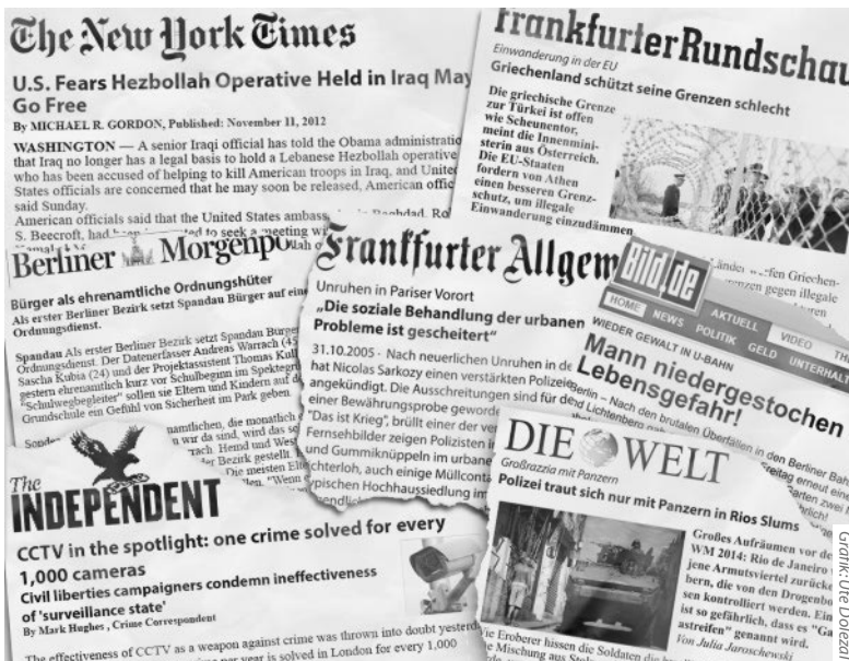
Abb. 1: Schlagzeilen über unsichere Räume in Printmedien