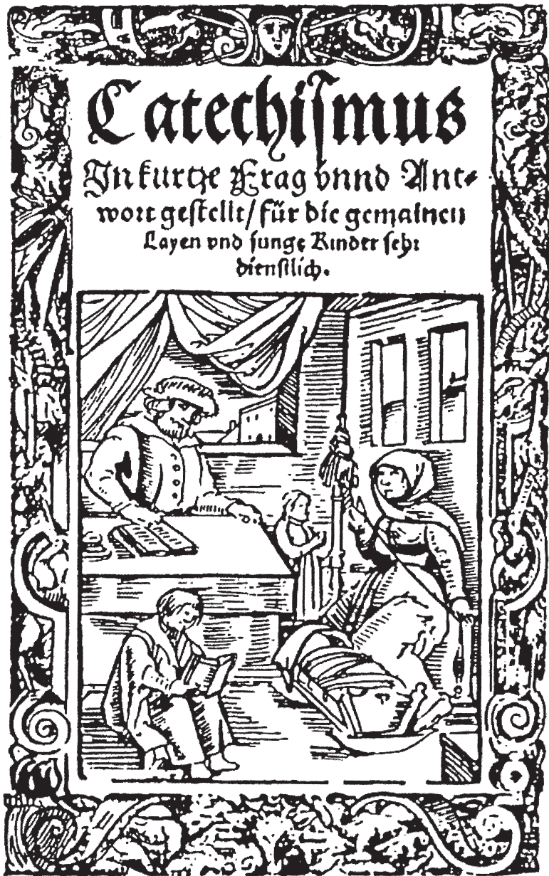
Abb. 1: Familienkatechese 1595. Holzschnitt. Buchillustration