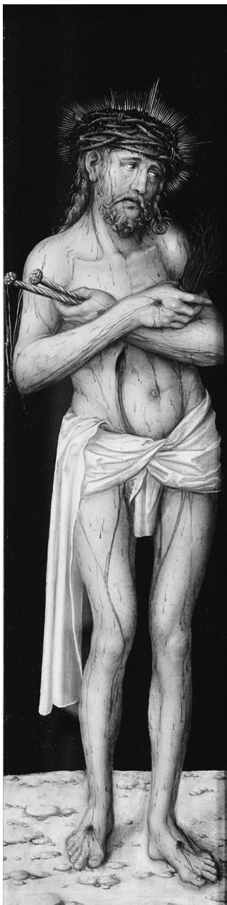
Der leidende Christus war vor der Reformation so präsent wie danach. Für Lukas Cranach blieb er ein und derselbe: Christus als Schmerzensmann, 1540 (linke Flügelaußenseite des Kreuzigungstriptychons)