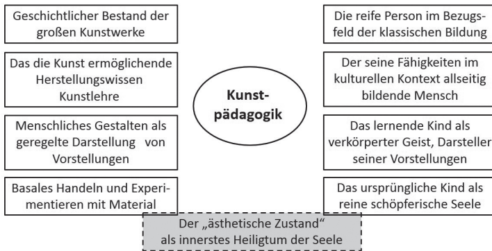
Abb. 1: Schema zur Interpretation der Geschichte des Kunstunterrichts: Fachgegenstand und Subjekt des Unterrichts werden darin in sehr verschiedener Weise bestimmt. (Schema: H. Sowa)

ferenzierteren Sinn einnimmt, sondern vielmehr in indifferenter Weise auf ein Feld der ‚ästhetischen‘ oder auch ‚künstlerischen‘ Erfahrung zielt, in dem Kind und Kunst zur Verschmelzung kommen. Gemessen an allen anderen Entwicklungsphasen des Fachverständnisses ist hier ein Nullpunkt erreicht.