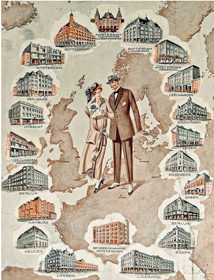
Reclameplaat van C&A Holland uit het voorjaar van 1924