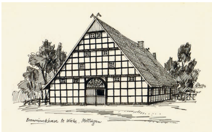
Afbeelding 2.1: De Brenninkhof in Mettingen.