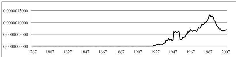
Grafik 2: Frequenzanalyse zum Trigramm ›State of emergency‹ in der englischsprachigen Literatur (1787–2008)

Erstellt mit dem Google Books Ngram Viewer, English Corpus (2016)