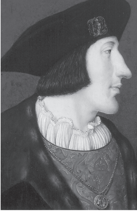
Herzog Karl III. von Savoyen. Das höfische Bildnis zeigt den ehemaligen Herrn Genfs mit anmutigen, fast feminin wirkenden Zügen. Die Genfer sahen ihn anders: machtbewusst, großsprecherisch und starrsinnig. Gemälde von Jean Clouet; Galleria Sabauda, Turin.

gesreisen von Genf entfernt. Ihm, Karl III. (beziehungsweise II. seines Namens, die Zählung differiert innerhalb der Dynastie selbst), gehörte nicht nur das Genf umschließende Gebiet einschließlich der Waadt im Norden, sondern auch das sogenannte vidomnat, die Stellvertretung des Bischofs in weltlichen Herrschaftsangelegenheiten. Dieses seiner Familie – einer der ältesten und vornehmsten innerhalb des schmalen Kreises der europäischen Hocharistokratie – seit Generationen zustehende Vorrecht wollte der Herzog zu einer faktischen Machtausübung ausdehnen. Damit drohte der Kommune an der Rhone das Schicksal, zu einer fürstlichen Landstadt und damit zum Objekt fremden Herrscherwillens herabgedrückt zu werden, eine für die urbanen Eliten der Zeit zutiefst abschreckende Vorstellung. Zu ausgeprägt war ihr Wille zur Selbstregierung ohne fremde Einmischung.