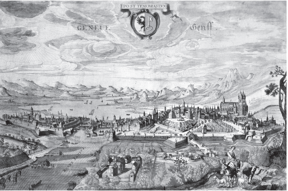
Die befestigte Stadt Genf um 1650. Kolorierter Kupferstich von Hendrick Focken.

ker und Ladenbesitzer politische Rechte besitzen sollten, lebte einerseits die Tradition und andererseits das seit der Zeit Calvins unerschütterliche Bewusstsein fort, Bürger einer erwählten Stadt zu sein. Durch seine großen Erinnerungen blieb Genf bis heute, was es schon immer war: eine bewegte, manchmal turbulente Stadt.