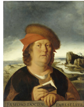
Portraits von Machiavelli, Pareto und Paracelsus, © picture alliance/CPA Media, picture alliance/dpa, picture alliance/Heritage Images