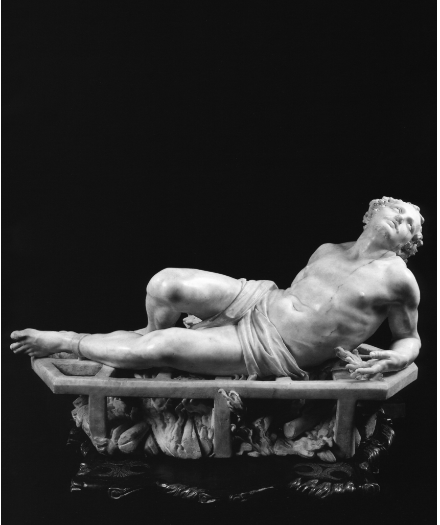
Abb. 1 Skulptur des Hl. Lorenzo, Sammlung Conti Bonacossi, Florenz (1617)

Dass der gerade einmal achtzehnjährige Künstler vor dieser Aufgabe nicht zurückschreckte, spricht für sein Selbstbewusstsein. Die Lösung, die er fand, ist noch nicht von der Vollkommenheit, die er