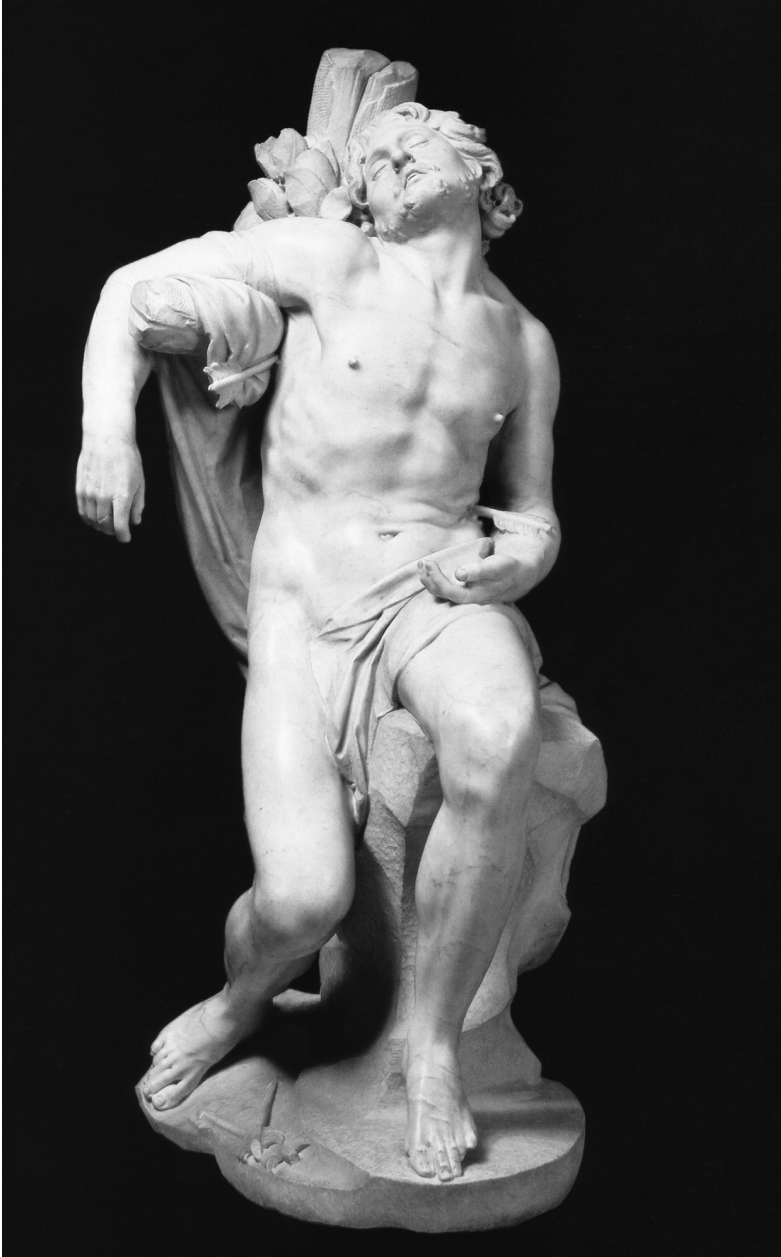
Abb. 2 Hl. Sebastian, Sammlung Thyssen-Bornemisza, Lugano (1617)