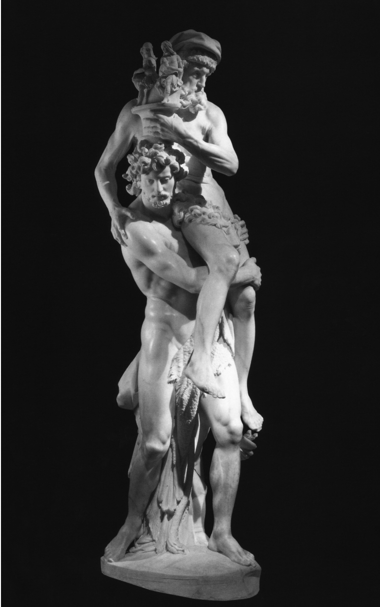
Abb. 3 Aeneas und Anchises, Villa Borghese, Rom (1618/19)