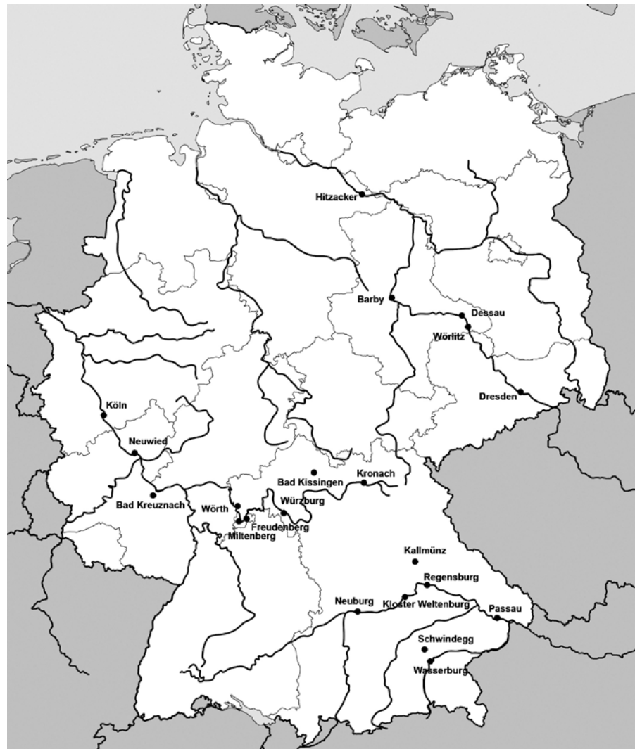
Abb. 1: Die in Fallbeispielen und Kurzportäts behandelten Orte.

Die untersuchten Anlagen und Bauwerke zeigen zum Teil vorbildliche Lösungen. Um zu verdeutlichen, dass es notwendig ist, Hochwasserschutz