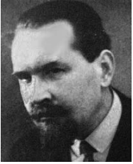
Nikolai Trubetzkoy (1890–1938)

der Strukturalismus ( structuralism ) ist entstanden. Saussures Werk wird erst posthum von seinen Studenten herausgegeben (Saussure (1916)). Unter anderem definiert Saussure zum ersten Mal das Zeichen ( sign ) als arbiträre Kombination von Signifikans und Signifikat. Er trifft auch die Unterscheidung zwischen langue , dem prinzipiell vorhandenen Wissen über eine Sprache, und parole , der aktuellen Sprachausübung, die Noam Chomsky aufgreift und als Kompetenz ( competence ) und Performanz ( performance ) bezeichnet.