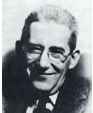
Leonard Bloomfield (1887–1949)

In den 1920er Jahren waren mehrere Linguisten der Prager Schule aktiv, unter ihnen der Begründer der Phonologie und späterer Ordinarius für Slawistik in Wien, Nikolai Trubetzkoy , sowie Roman Jakobson , der später in Harvard und am MIT, dem heutigen Zentrum der generativen Grammatik, lehrte. Die Mitglieder der Prager Schule führten den Strukturalismus weiter: Sie suchten die kleinsten Einheiten der Sprache auf der Laut- und Wortebene und untersuchten deren Kombinationsmöglichkeiten. Trubetzkoy (Trubetzkoy (1939)) entwickelt den Begriff des Phonems ( phoneme ).