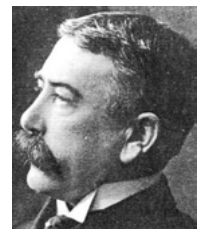
Ferdinand de Saussure (1857–1913)

Im frühen 20. Jahrhundert tauchte eine neue Idee auf, die zunächst die Sprachwissenschaft, in der Folge auch die Kulturwissenschaft (etwa im Sinne der Literaturwissenschaft) nachhaltig beeinflusste. Der Schweizer Linguist Ferdinand de Saussure betrachtete die Sprache nicht mehr in ihrer historischen Entwicklung, sondern als eigenständiges System, dessen Funktionsweise es herauszufinden gilt. Dieser synchrone Blick unterscheidet sich fundamental von der bisherigen, diachronen Betrachtungsweise. Untersucht wird nun, woraus das System besteht, und nach welchen Regeln diese Bestandteile zusammengefügt werden. Es geht um den Aufbau und die Struktur des Sprachsystems: