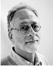
Michael Tomasello (*1950)

Michael Tomasello (Tomasello (1992), Tomasello (2000a), Tomasello (2009)) schlägt vor, dass für den Grammatikerwerb der sprachliche Input irrelevant ist. Es kommt also seiner Meinung nach nicht darauf an, welche sprachlichen Daten das Kind hört. Viel wichtiger ist die Fähigkeit zur sozialen Interaktion mit der Bezugsperson. Konkret geht es darum, dass das Kind und die Bezugsperson gemeinsam auf Dinge referieren (= sich beziehen) können. Zeigt die Bezugsperson etwa auf ein Auto und sagt „Auto“, so ist auch ihre Aufmerksamkeit, meistens auch ihre Augen, auf das Auto gerichtet. Das Kind, das Sprache erwirbt, muss die Aufmerksamkeit der Bezugsperson verstehen, es muss verstehen, dass die Person auf das Auto schaut. Erst wenn das Kind versteht, dass das lautliche Zeichen „Auto“ sich auf das bezieht, worauf die Aufmerksamkeit der Bezugsperson gerichtet ist, kann es das Wort lernen.