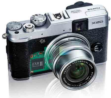
Die X20 weckt Emotionen und Begeisterung.

Nun reicht es aber nicht, einfach nur das Design der Kamera auf alt zu trimmen – ein stimmiges Gesamtkonzept ist gefragt. Schließlich soll ein solches Modell ja nicht nur Nostalgiker ansprechen, sondern auch den modernen Fotografen, der ein ausgefallenes und hochwertiges Design sucht.