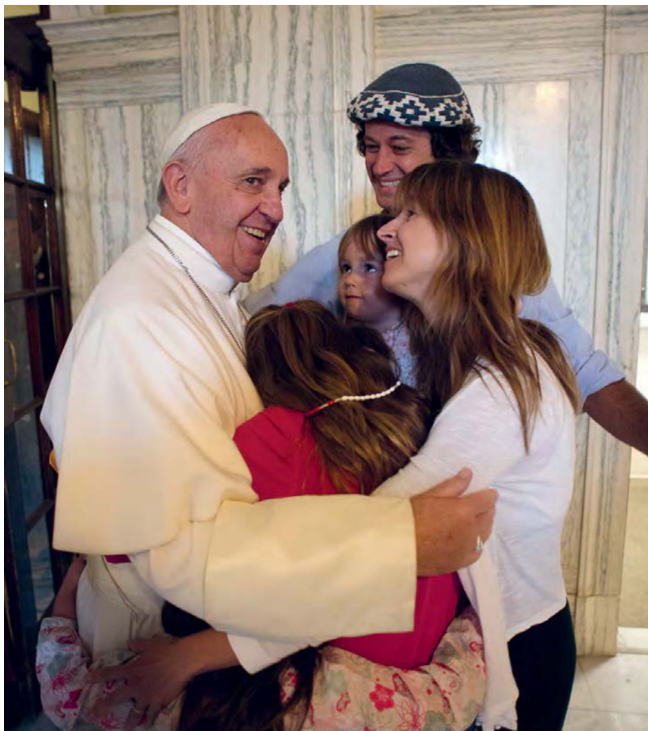
Abb. 2: „Papst Franziskus am Weltfamilientag am vergangenen Sonntag in den Vereinigten Staaten“, in: Frankfurter Allgemeine Sonntagszeitung , 4. Oktober 2015.

position aus mehreren, aufeinander bezogenen Einzelgesten. Eine der Frauen, sie ist dem älteren Mann am deutlichsten zugewandt, beugt sich vor und legt ihren Kopf – ihr Gesicht – an seine Brust. Während ihr Unterkörper sich von dieser Zuwendung distanziert (vgl. Abb. 2), geht ihr Blickkontakt zu dem von ihr Umarmten in der errungenen Nähe verloren. Diese Frau wird ihrerseits umarmt von einer jungen Frau, deren Umarmungsgeste sich bis zur Hüfte des älteren Mannes fortsetzt. Das Bild zeigt ihr Gesicht im Halbprofil. Ihr Kopf ist erhoben und – in Richtung des Kindes – leicht schräg geneigt. Sie lächelt mit geöffneten Augen und geöffnetem Mund: Die obere Zahnreihe ist gut zu sehen. Ihr Lächeln wendet sich gezielt an das Gegenüber. Auch dieses lächelt mit halbgeöffnetem Mund, und auch hier ist die obere Zahnreihe gut zu erkennen.