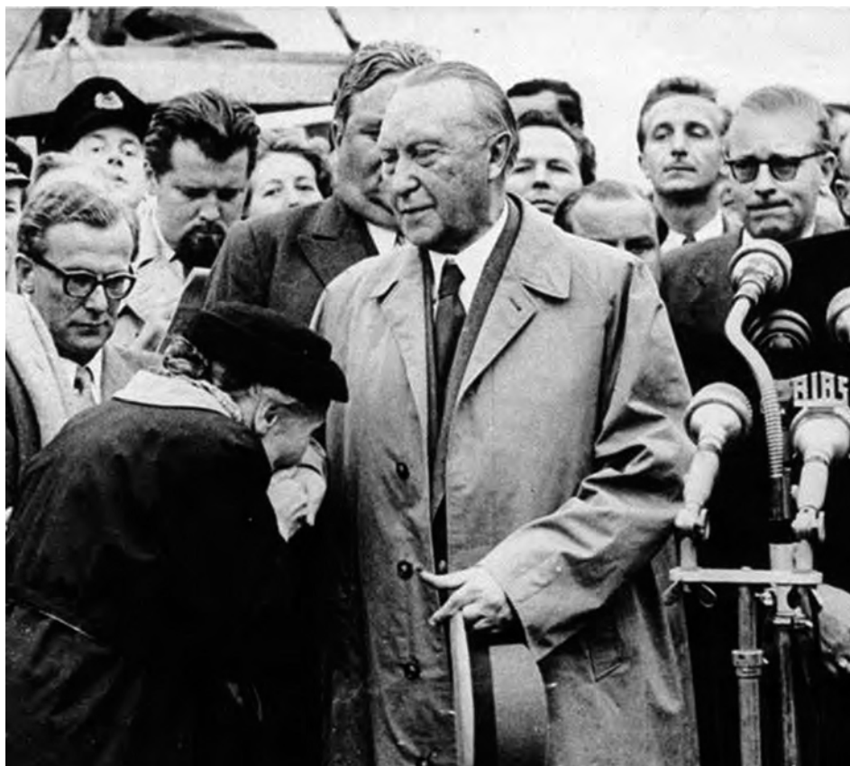
Abb. 1: „1955. Adenauers Rückkehr aus Moskau“, in: Generalanzeiger , Bonn, 14. September 1955, S. 1.

selseitig interpretieren. Innerhalb dieser Verhaltensordnung signalisiert die Ausdrucksgebärde ‚der alten Frau‘ Demut, Schutzsuche, Ehrerbietung und Dank.