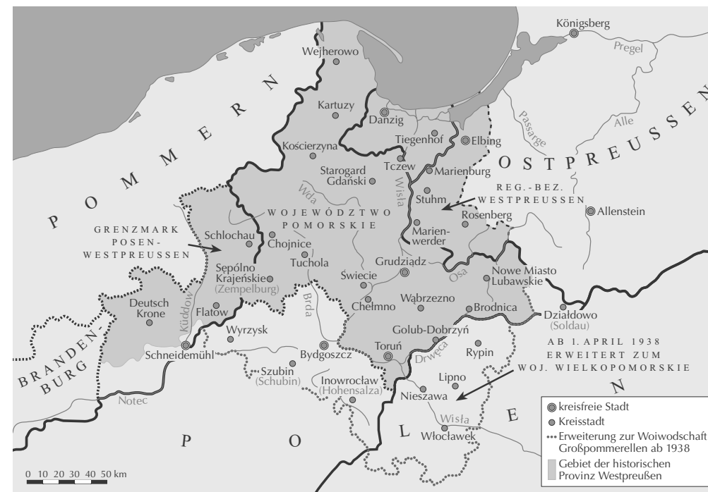
II/2: Die territoriale Neuordnung ab 1920