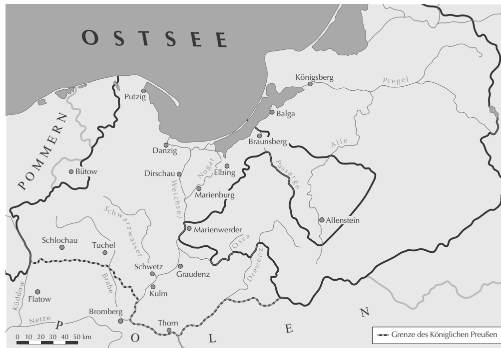
I/2: „Prussia Occidentalis“ – Die Struktur des Gebiets ab 1454