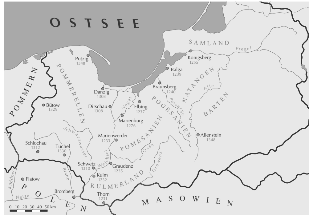
I/1: Das Territorium des Deutschen Ordens