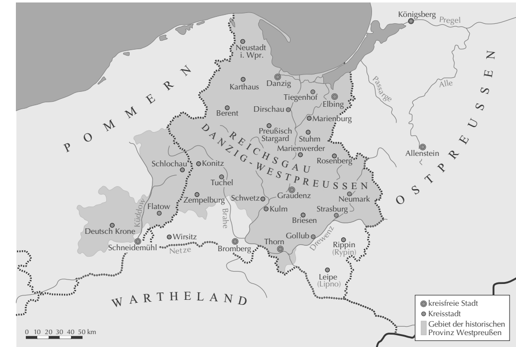
II/3: Der Reichsgau Danzig-Westpreußen von 1939 bis 1945