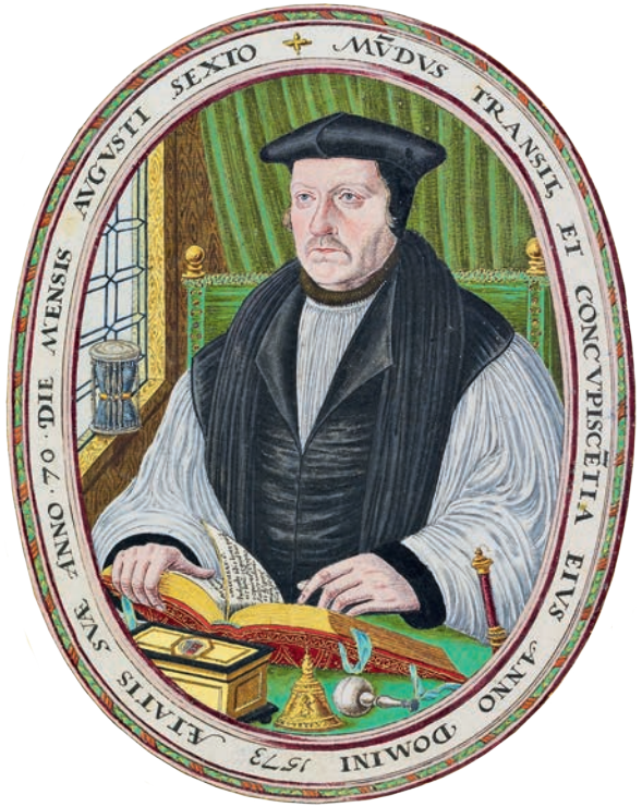
Matthew Parker (1504–1574). Der 1573 entstandene Stich von Remigius Hogenberg zeigt den Erzbischof in seinem 70. Lebens- jahr bei der Lektüre der Bibel.

Es überdauerte als Institution am Rand der Stadt Canterbury nahezu ein Jahrtausend, bis es 1538, also zu Lebzeiten Matthew Parkers, unter Heinrich VIII. aufgelöst wurde. Das Gebäude existiert bis heute.