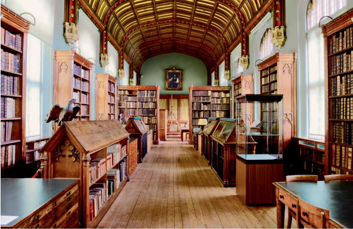
Die Büchersammlung Matthew Parkers in dem von William Wilkins (1778–1839) entworfenen Raum im Obergeschoss des Corpus Christi College, Cambridge.

gelegenen Gonville and Caius College übertragen. Das Gleiche sollte auch für einige wirklich begehrenswerte Stücke Tafelsilber der Tudorzeit gelten, die ebenfalls aus Parkers Besitz stammten. Die Angst vor dieser furchtbaren Strafe war wohl der Hauptgrund dafür, dass man es im Lauf der Jahrhunderte relativ wenigen Außenstehenden gestattete, die Handschriften in Augenschein zu nehmen. Mehr als vierhundert Jahre lang war die Parker Library notorisch dafür, Interessierten in schon skandalöser Weise den Zugang zu den Werken zu verwehren. Sie wurden nur ab und an zur Verfügung gestellt, wobei nie vorhersehbar war, ob und wann. Nicht ohne eine spezielle Art von Stolz darf ich berichten, dass man mich, als ich Mitte der 1970er-Jahre bat, in ein Manuskript Einblick zu nehmen, dort abschlägig beschied – als einzige Bibliothek der Welt, die mir bis heute den Zutritt verweigerte. Leser auszuschließen bedeutet aber auch, dass jeder der Bände der Sammlung sicher in den Regalen stehen bleibt, und viele von ihnen befinden sich in einem erstaunlich »frischen« Zustand, das heißt mehr oder weniger in demselben, in dem sie sich zur Zeit der Reformation befanden. Sie sind länger im Besitz ein und derselben