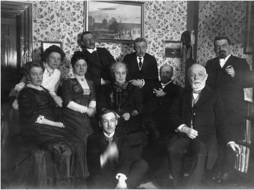
Abb. 6: Die Familien Hamm und von Merz, um 1910

mit einem Klavierauszug der „Götterdämmerung“ und den „Kleinstadtgeschichten“ von Ludwig Thoma bedacht. 10