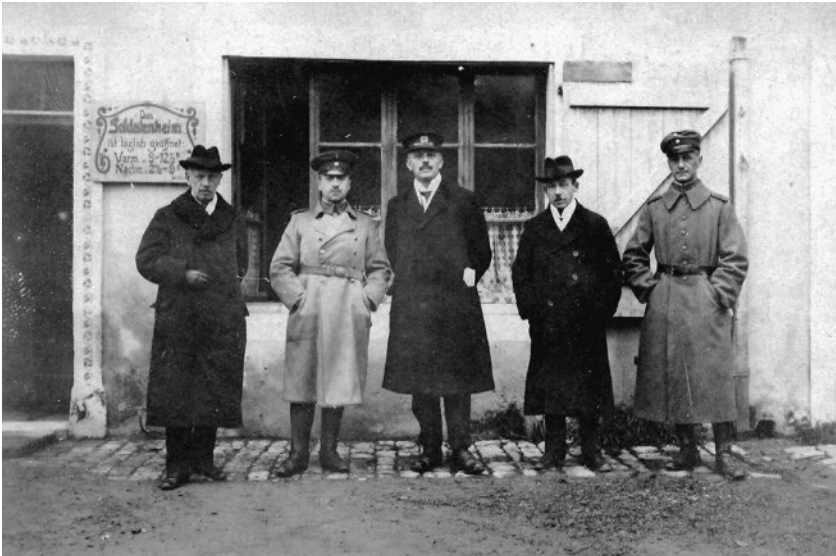
Abb. 4: Eduard Hamm (2. v. r.) bei einem Frontbesuch in Frankreich, links neben ihm der spätere Reichswehrminister Otto Gessler, Frühjahr 1915

Leute“ hervorhob. 5 Im Oktober 1917 warb er in einem der sogenannten „Kriegsvorträge“ an der Universität München für Geduld und Nachsicht gegenüber den Belastungen vor allem des Mittelstands durch die Zwangswirtschaft. 6 An der Technischen Hochschule München nahm er im Wintersemester 1918/19 auch noch einen juristischen Lehrauftrag wahr.