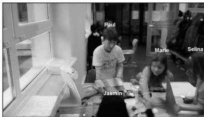
Fotogramm 1 (00:29:17)