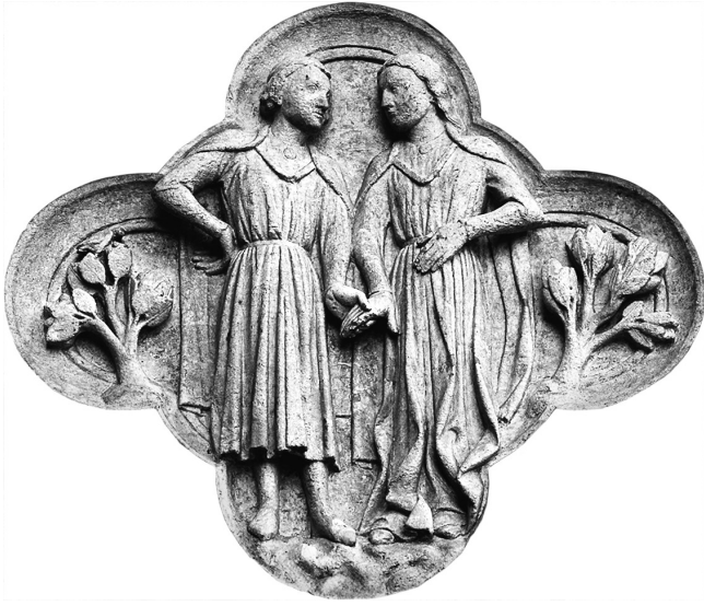
Relief eines Liebespaars an der Fassade der Kathedrale von Amiens, um 1230