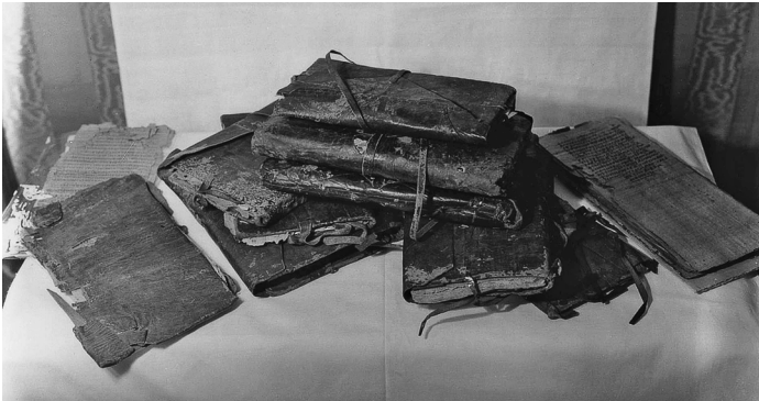
Im ägyptischen Nag Hammadi wurden 1945 dreizehn in Leder gebundene Codizes gefunden, die 47 unterschiedliche Schriften enthalten.

skripte, vornehmlich der Kindheitsevangelien und des Nikodemusevangeliums, bekannt. Die bereits genannte Ausgabe von Fabricius aus dem Jahr 1703 listet antike christliche Erwähnungen dieser Schriften auf und bietet griechische bzw. lateinische Texte. Des Weiteren enthält diese Ausgabe einen Teil «Über Worte Christi, unseres Retters, die in den vier kanonischen Evangelien nicht enthalten sind» ( De Dictis Christi Servatoris Nostri, Quae in quatuor Evangeliiis Canonicis non extant ).