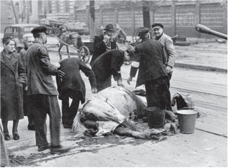
Nach dem Ende der Kämpfe in Berlin am 2. Mai 1945: Berliner schneiden sich Fleischstücke aus einem Pferdekadaver.

Von der vielbeschworenen «Volksgemeinschaft», die immer mehr propagandistisches Wunschbild als Realität gewesen war, war buchstäblich nichts übriggeblieben. Jeder war sich selbst der Nächste und nur noch damit beschäftigt, für sich und die Familienangehörigen das Lebensnotwendige zu ergattern. «Die Menschen fielen übereinander her, schlugen sich, rissen sich die Sachen vom Leibe, rafften zusammen, was sie nur erreichen konnten.» 28