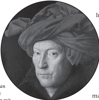
Jan van Eyck: Mann mit dem roten Turban, wahrscheinlich ein Selbstporträt

In Dijon, Brüssel, Gent, Brügge und an vielen anderen Orten entstanden Meisterwerke des Bildhauers Claus Sluter und der Maler Jan van Eyck, Rogier van der Weyden und Hugo van der Goes, die polyphone franko-flämische Musik und nicht zuletzt Kaufmannshäuser, Kathedralen, Hospitäler und Rathäuser, die bis heute unzählige Besucher in das ehemalige Burgund locken.