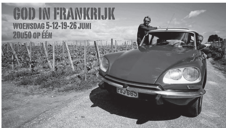
Werbung für die vierteilige Serie «Gott in Frankreich», 2013