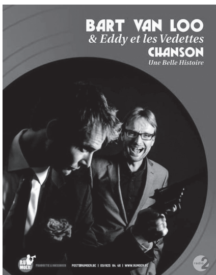
Plakat für die Tournee «Chanson. Une Belle Histoire» mit «Eddy et le Vedettes», 2014–2015

2012 und 2013 reiste Bart Van Loo für die vierteilige Fernsehdokumentation Gott in Frankreich in einem alten Citroën DS durch Frankreich, auf den Spuren der Tour de France sowie französischer Küche, Literatur und Chansons. Seinen Durchbruch als Bühnen-Entertainer erlebte er 2014 mit der musikalisch-literarischen Show Chanson. Une Belle Histoire zusammen mit der Gruppe «Eddy et les Vedettes», die über mehrere Spielzeiten in vielen Theatern aufgeführt wurde.