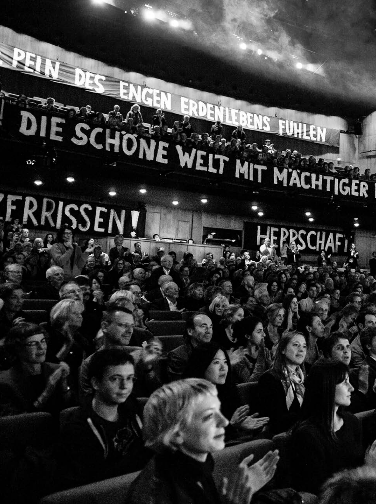
Faust I + II , Inszenierung: Nicolas Stemann, Theatertreffen, Haus der Berliner Festspiele, 2012.