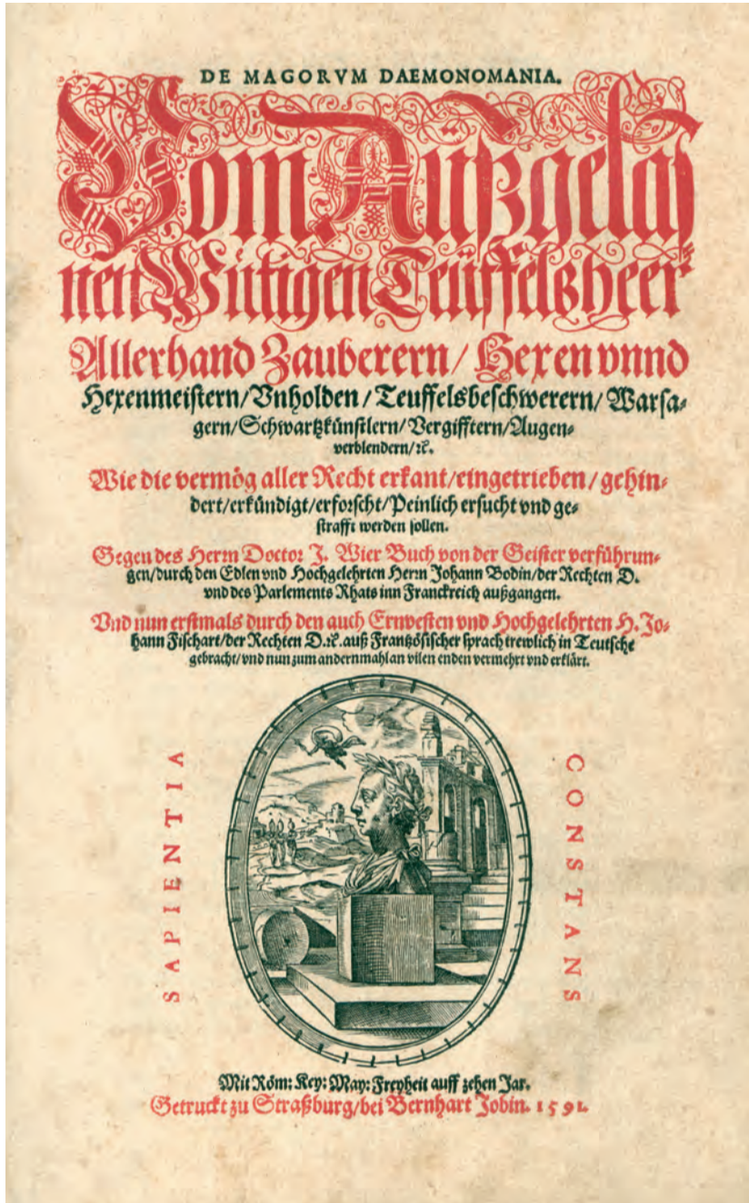
Titelblatt der Ausgabe von 1591 (VD 16 B 6271). Exemplar der Universitäts- und Landesbibliothek Sachsen-Anhalt, Halle (Saale), Signatur: AB 99143,